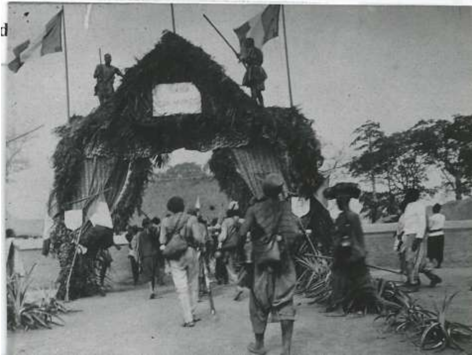
6) Entrée du poste de Bouaké en 1902 .