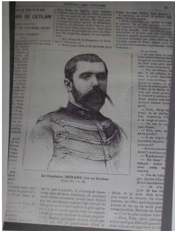
8- 9) Capitaine Ménard (1/09/1861 à Lunel -4/ 02/ 1892 à Séguéla) tué par les sofa de Samory alors qu'à l'appel du chef du pays, il défendait Séguéla. La plaque de bronze reproduite ici, orne le monument que l'Administrateur LACASCADE a fait ériger en 1937 devant l'ancienne poste, devenue la Direction Régionale des mines