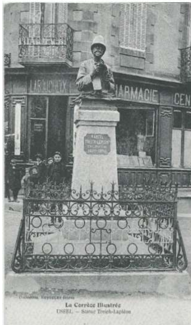
7) Monument à Treich-Laplène (24/06/1860 à Ussel .9/03/1890 à Grd. Bassam) Résident de France. Le monument se trouve aujourd'hui dans le parc de la Mairie. Par les traités qu'il passa avec les rois des localités de l'est de la Côte d'Ivoire ,qui placent celle-ci sous la souveraineté de la France, il dressa une véritable barrière entre la Côte d'Ivoire et la Gold Coast qui mit un terme aux convoitises anglaise sur notre colonie.