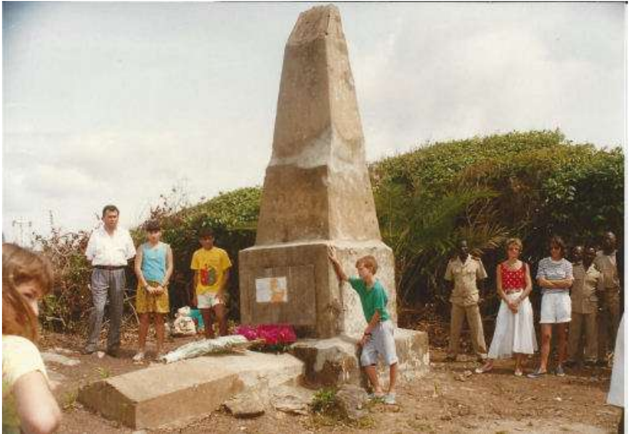
4 Commémoration du centenaire de la mort du Lieutenant Quiquerez, (15/10/1863 à Paris-22/05/1891 à San Pedro); Les traités qu'il signa avec les rois des localités du littoral ouest, (Béréby à la frontière du Liberia), vont permettre à Binger de placer ce littoral sous la souveraineté de la France.