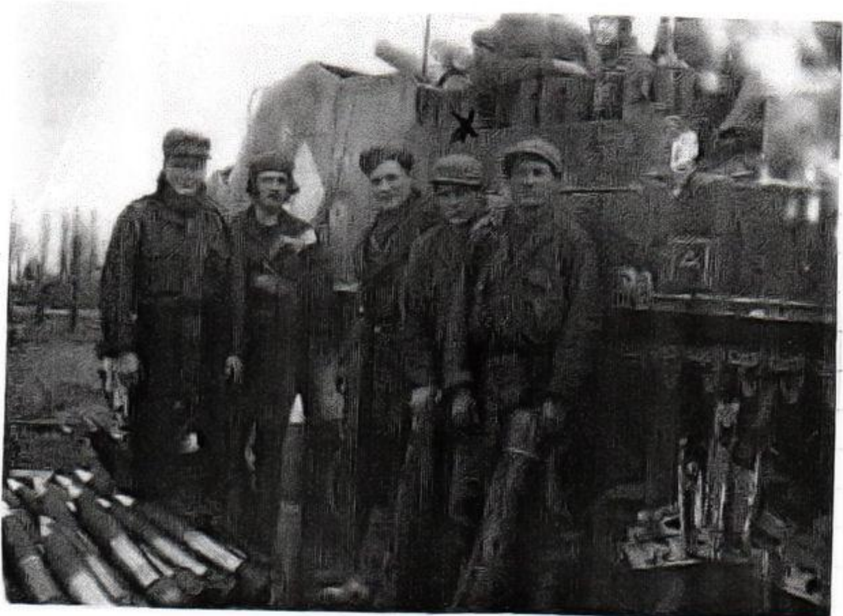
Equipe de pièce sur le char M 7 à St HYPPOLITE