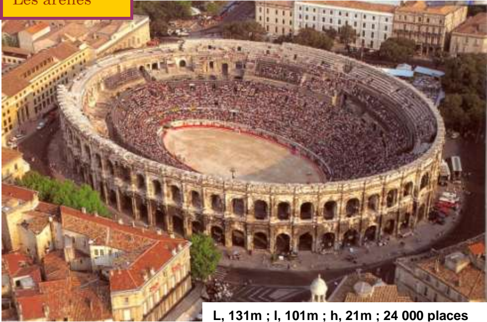
L, 131m ; l, 101m ; h, 21m ; 24 000 places