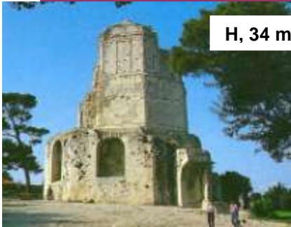
H, 34 m